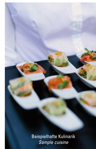
Beispielhafte Kulinarik Sample cuisine