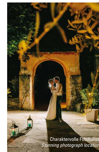
Charaktervolle Fotokulisse Stunning photograph locations